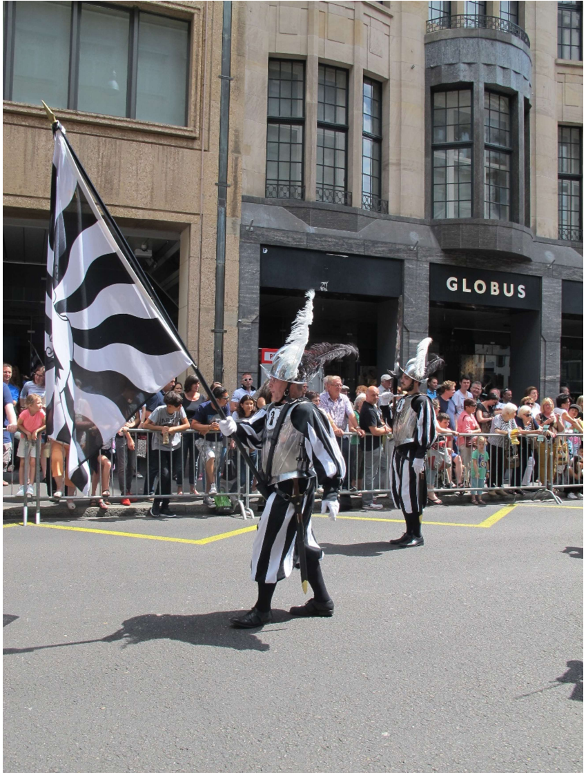
KTV Basel 1915 - 2016 Herbstausgabe