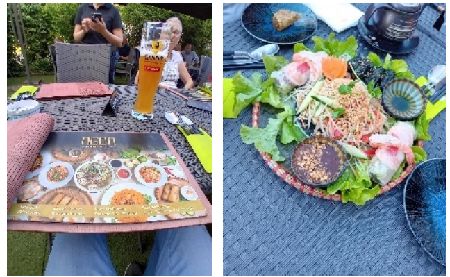
Xin cam o'n

Die Bäuche sind gefüllt, der Abend lau und feucht wie in Saigon und wir verabschieden uns.