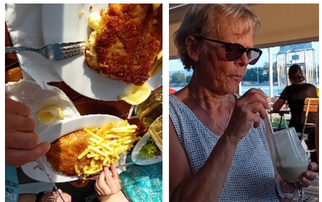
... und das auch!